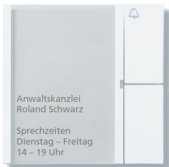
TM 612-1 oder BTM 650-01 1 Beschriftungsfolie