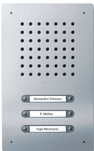
CL A 03 3 Beschriftungsfolien

Unten: die Module mit der ge- wünschten Beschriftung