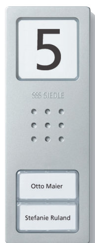
Compact-Türstation Für die Compact-Türstation gibt es 3 unterschiedliche Beschriftungsfolien – in diesem Beispiel sind dies: CA/CV 1 CA/CV 2