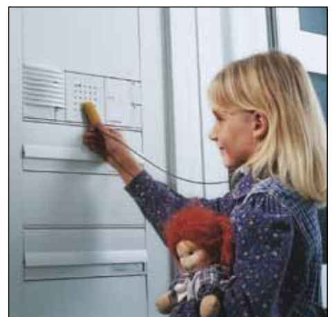
Vom Briefkasten bis zur Zutrittskontrolle: Moderne Türkommunikationssysteme integrieren die gesamte Installation, die am Eingang gebraucht wird. Siedle bringt das komplette Funktionsspektrum mit einer Schnittstelle in die IP-Welt.

Peter Strobel, Presse- und Öffentlichkeitsarbeit für S. Siedle & Söhne Telefon- und Telegrafentelewerke OHG, Furtwangen