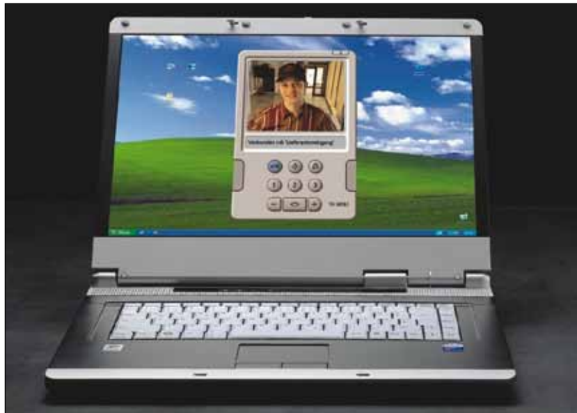
Tür an PC: Siedle macht mit der Schnittstelle DoorCom-IP die Türstation zum Teilnehmer eines IP-Netzwerks. Die Client-Software entspricht in Design und Funktion einer Siedle-Sprechstelle und ist ebenso einfach zu bedienen.