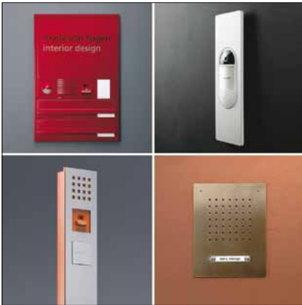
Design- und Funktionsvielfalt an der Tür: Eine Schnittstelle verbindet die Türstationen mit dem IP-Netzwerk. An der Tür ist kein spezielles IP-Gerät erforderlich, die freie Auswahl aus dem gesamten Produktsortiment bleibt erhalten.

erhöhte Aufwand schlägt sich im Platzbedarf und auch in den Kosten nieder. IP-Endgeräte sind gegenüber herkömmlicher Technik teurer, und mit zunehmender Zahl der Türen und Sprechstellen öffnet sich die Kostenschere weiter. Zudem muss der Anwender trotz höherer Investitionen derzeit häufig Leistungseinbußen in Kauf nehmen. Demgegenüber stehen Ansätze, die auf Schnittstellen zwischen herstellereigenen Kommunikationssystemen und dem IP-Netzwerk setzen. Der Übergabepunkt sitzt im Verteiler- oder Serverschrank. Nach innen nutzt die Türkommunikation das Ethernet als Übertragungsweg und die Netzwerk-PCs als Innenstationen. Am Eingang arbeiten die gleichen Türstationen, die auch bei herkömmlicher Installation zum Einsatz kommen. Vorteil: Die Signalaufbereitung für das IP-Protokoll übernimmt nicht das Endgerät, sondern die Schnittstelle, die ihren Platz dort findet, wo sie nicht stört. Die Endgeräte brauchen keine zusätzlichen Bauteile, sind nicht teurer und arbeiten mit bewährter, zuverlässiger Technik. Zudem bietet die Schnittstelle die Möglichkeit, parallel zum IP-Netz eine Installation mit herkömmlichen Innensprechstellen zu planen, beispielsweise als autarke, von PC und Netzwerk unabhängige Fallback-Lösung für unverzichtbare Basisfunktionen wie Klingeln, Überwachen und Türöffnen.