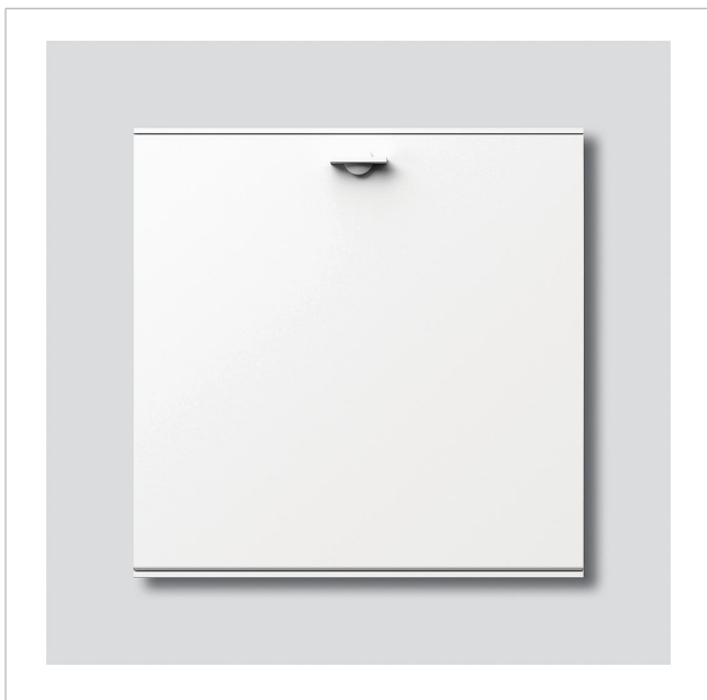
Ablagefach-Modul AFM 611-4/4-0 W 200017499-00