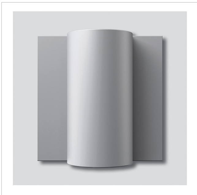
LED-Spot LEDS 600-0 SM 200036617-00