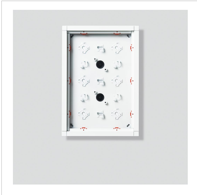
Gehäuse-Aufputz GA 612-3/2-0 AG