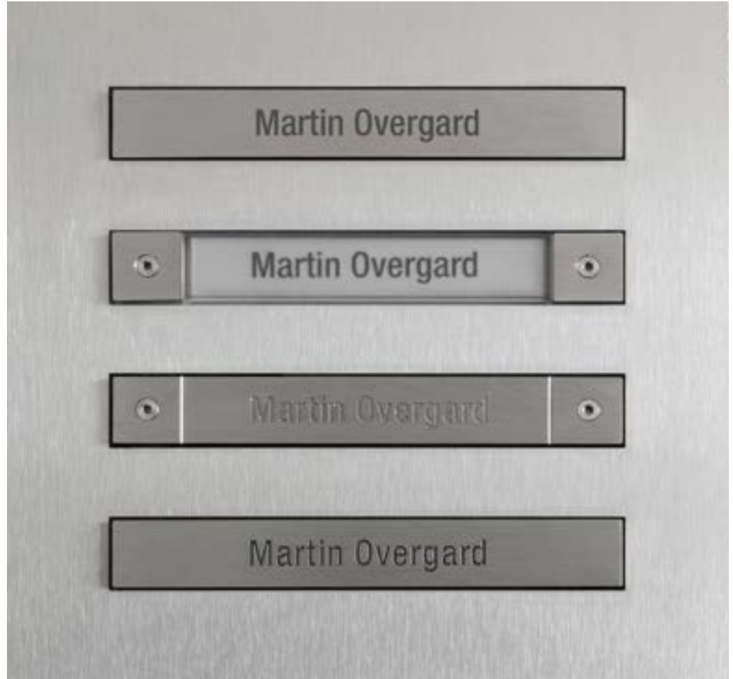
Rotulación original, tamaño original