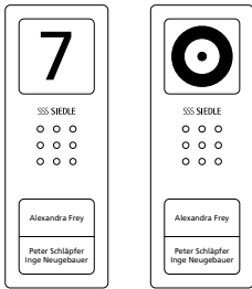
2 Tasti di chiamata

Grafici come da modello pronto per la stampa. File: