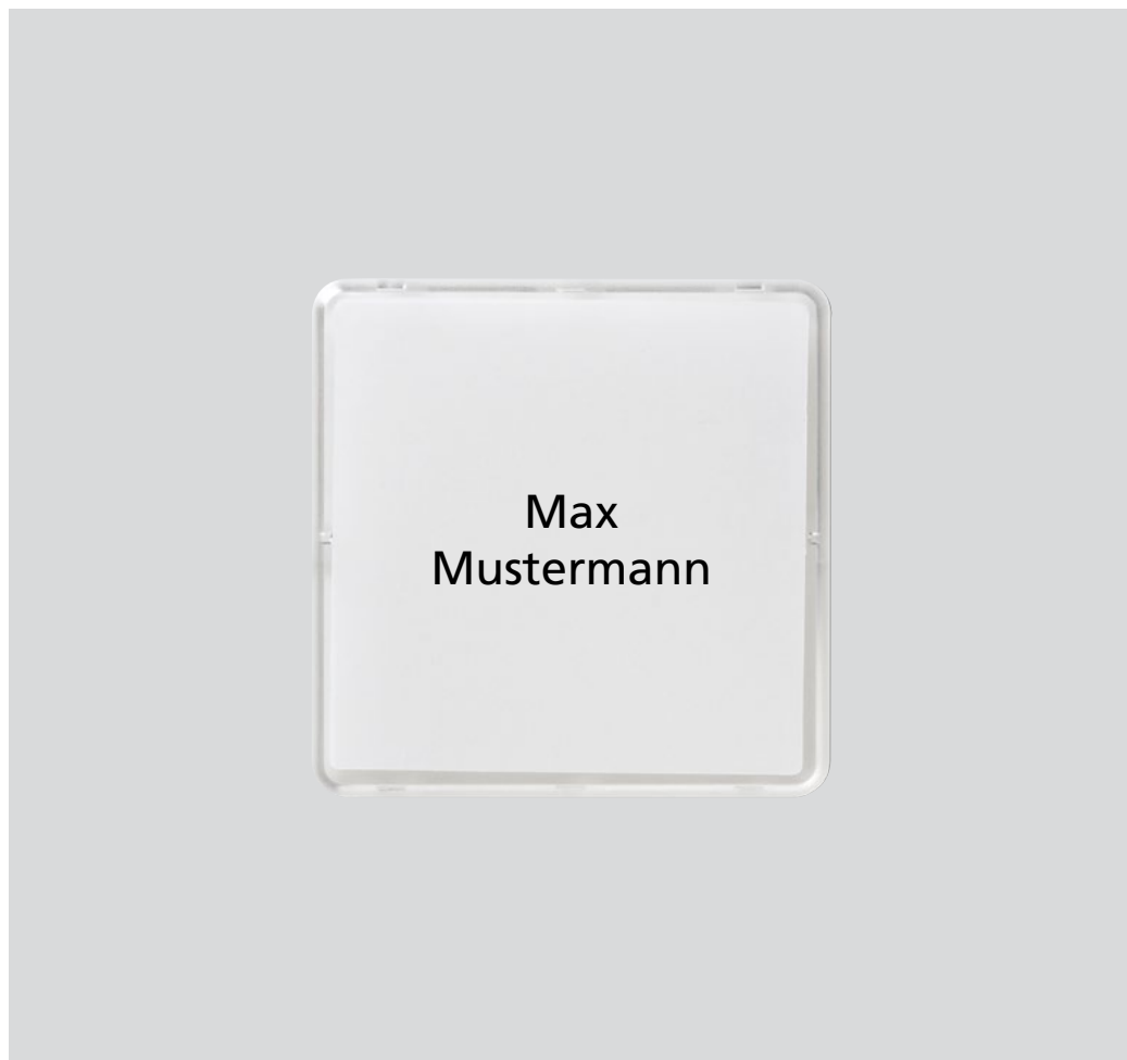
Carattere originale, dimensioni originali